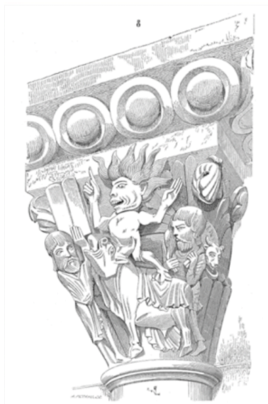
Fig 2 Capitel românico

«Mas, no claustro, sob os olhos dos irmãos que ali se dedicam à leitura, que proveito existe nesses ridículos monstros, nessa maravilhosa e deformada beleza, nessa bela deformidade?»