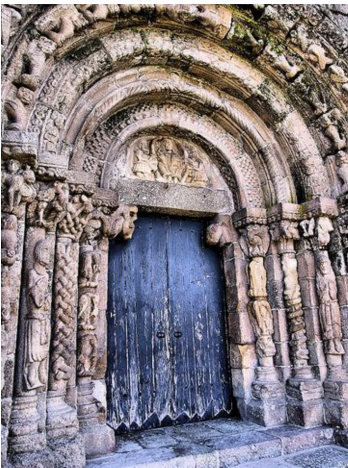
Fig 4 Portal da Igreja de Bravães

9. Identifica os espaços da planta referenciados na Figura 3. (20 pontos)