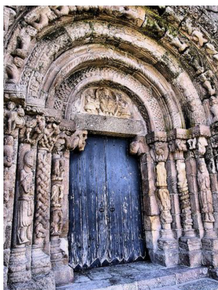
Fig 4 Portal da Igreja de Bravães

"as obras de arte têm pleno direito de existir; pois o seu fim não era ser adoradas pelos fiéis, mas ensinar os ignorantes. O que os doutores podem ler com a sua inteligência nos livros, o vêem os ignorantes com os seus olhos nos quadros e nos relevos." Papa Gregório Magno