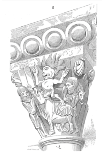
Fig 2 Capitel românico

«Mas, no claustro, sob os olhos dos irmãos que ali se dedicam à leitura, que proveito existe nesses ridículos monstros, nessa maravilhosa e deformada beleza, nessa bela deformidade?»