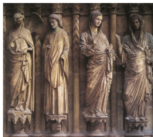
Fig 4 Grupo escultórico da Anunciação e Visitação, Catedral de Notre-Dame de Reims, França, 1225-1245.

9. Identifica os elementos arquitetónicos numerados na Figura 3. (20 pontos)