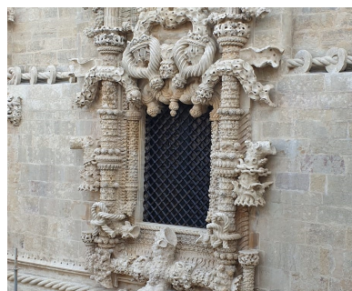
Fig 2 Janela da sala do capítulo do convento de Cristo, em Tomar

8. Refere três fatores que motivaram as temáticas desenvolvidas na arte manuelina. (15 pontos)