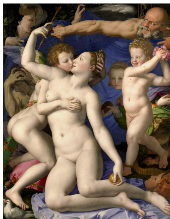
Bronzino, Alegoria do Triunfo de Vénus, 1540-45