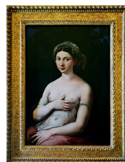
Rafael Sanzio, La Fornarina