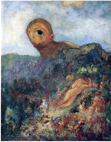
Fig. 1, O Ciclope, c. 1898/1900